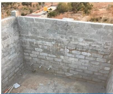
Watertank van 50.000 liter