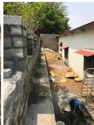
20 studenten uit Bangalore doen seva op de Ashram